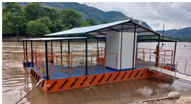
Ilustración 7 - Embarcadero tipo "C" - Honda (Tolima)