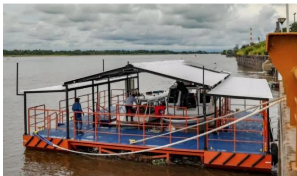
Ilustración 8 - Embarcadero tipo "C1" - Barrancabermeja (Santander)