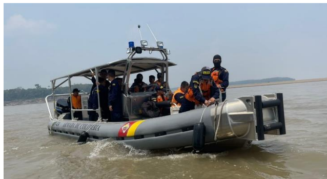
Ilustración 6 - Bote tipo “F”

Bote tipo F: El 11 de octubre de 2024, se entregó un (01) Bote tipo “F” en el marco de un contrato con el Ministerio del Interior - FONSECON con destino a la Armada de Colombia - Guardacostas de Leticia, para el patrullaje, reacción y apoyo ante eventos de emergencia, salvaguardando la vida humana en efluentes fluviales y contrarrestar el accionar enemigo en esa zona del país.