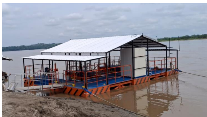
Ilustración 9. Embarcadero tipo "E" - Puerto Berrío (Antioquia)

Estos embarcaderos fueron diseñados para mejorar las condiciones de acceso, cargue y descargue de mercancía y fomentar el turismo en las comunidades ribereñas principalmente a lo largo del río Magdalena.