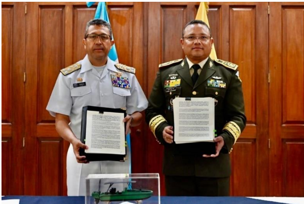
Ilustración 10. Firma Convenios de Cooperación con el Ministerio de la Defensa de Guatemala - sep/24

Con lo anterior, COTECMAR continúa estrechando lazos de cooperación con Marinas Latinoamericanas en el marco de actividades propias de la industria naval.