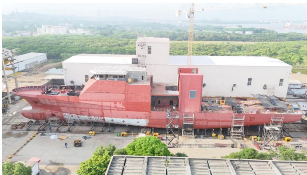
Ilustración 2 - Avance proceso de construcción Patrullera Oceánica Colombiana – POC – sep/24