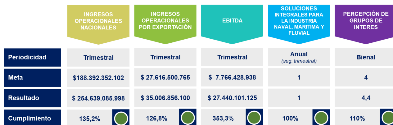
Ilustración 3 - Indicadores estratégicos COTECMAR (2023-2026) – avance a sep-24

La tendencia creciente de los ingresos operacionales da señas de un buen comportamiento en lo corrido del año, observando que en el cierre de septiembre se superó la meta establecida tanto en los ingresos nacionales como los de exportación con un 135,2% y 126,8% respectivamente; este último se vio favorecido por la Tasa Representativa del Mercado (TRM) y por los resultados alcanzados en la gestión de los proyectos de construcciones y reparaciones realizados con clientes extranjeros.