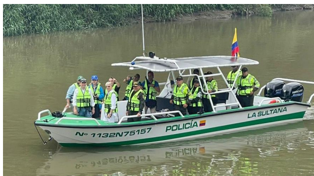
Ilustración 5 - Lancha Policía “La Sultana”.

Lancha Policía: El pasado 30 de septiembre de 2024, se entregó una (01) embarcación menor tipo “Lancha” a la Secretaría de Seguridad y Justicia de Santiago de Cali Distrito Especial, con destino a la Policía Nacional para efectuar patrullajes fluviales y operativos, contra delitos como el tráfico de estupefacientes, minería ilegal, delitos ambientales, entre otros.